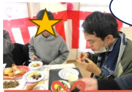
いくらでも 食べれます