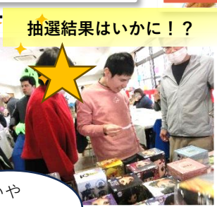
抽選結果はいかに!?