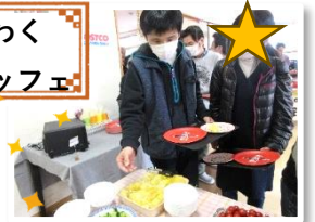
コストコレストランの開店♡