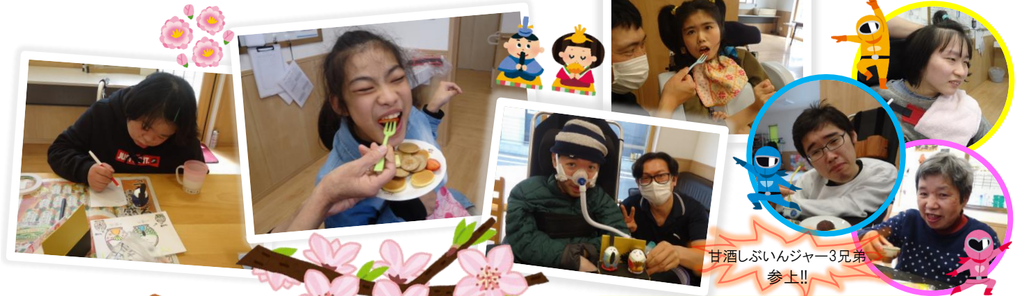
甘酒しぶいんジャー3兄弟 参上!!

3月のkaze・活は「ひな人形づくり」と「ひな祭り」を開催しました。普段は木曜日に開催していますが、「ひな人形づくり」は希望される利用者さんに行って頂きました！完成した後の嬉しそうな表情が印象的でした(^^)「ひな祭り」は甘酒（ノンアルコール）をお出ししました♪昨年同様、皆さまの『しぶ〜い』表情が出ていましたよ(笑)